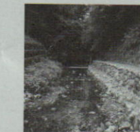
遊歩道を歩いてみませんか。